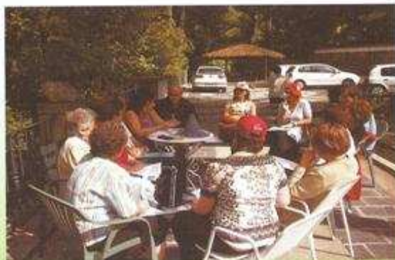
Aportación a las Jornadas 65 euros.

INFORMACIÓN E INSCRIPCIÓN: DELEGACIONES DE MISIONES